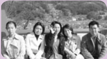
津和野市内を一望

今年の事務所旅行は、萩・津和野へ行ってきました！ 何年ぶりかの新幹線での旅行…。あっというまに新山口駅に到着し、バスで津和野へ。殿町通りや周辺の散策後、優雅に泳ぐ鯉と別れたら、早めに宿のある萩市へ移動です。チェックインも早々にお風呂に入り、夕陽を眺め、心身ともにリフレッシュ。毎年恒例大宴会ではおいしい海の幸に舌鼓を打ち、その後はふたたびお風呂に入って…と、ゆったりとした夜を過ごしま