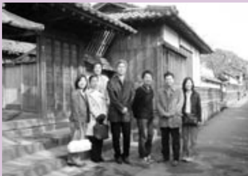
観光組、楽しそうです。

次の日は萩市内の観光、萩焼体験、一人旅 (!) の3コースに分かれての日程。観光組は一人旅コースの人と遭遇しつつ、木戸孝允旧宅、高杉晋作旧宅、松下村塾などの名所旧跡を時間いっぱい堪能しました。