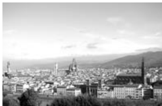
ミケランジェロ広場からフィレンツェの街を眺める

3 ローマでは、まず、Italia Nostraという世界的に有名な環境保護団体を訪れました。ここで驚いたのは、1971年の時点で、裁判所が、まだ法定されていなかった団体訴権をこの団体に認めた（法定されたのは1986年）ということです。このItalia Nostraは、公益的な見地から、幹線道路の工事差止等を求めて訴訟を行ったりするなど、活発な活動をしているようでした。