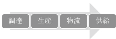
【図2】サプライチェーン

なお、この分業の型は、ビジネスの型とも対応している。旧来のビジネスは「事業者」→・・・→「消費者」というリニア(直線型)構造をとっていた。上記【図1】【図2】は、旧来型のビジネスの2つの代表的なモデルであるバリューチェーン(価値の連鎖)とサプライチェーン(調達から供給までの連鎖)の考え方の模式図である。もちろん、この左端には事業者があり、右端には消費者がいる。 4)