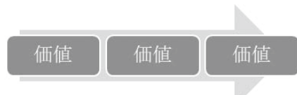
【図1】バリューチェーン

その後、消費者法の分野では、より責任の範囲を拡張する「媒介者の法理」が明文化された。消費者契約法(2000年制定)5条の媒介者責任や、割賦販売法35条の3の13の加盟店の不当勧誘を理由とする個別クレジット契約の取消権(2008年に新設)がそれであるが、これもやはり、結局のところ、「事業者」(クレジット会社)→「媒介者」(加盟店)→「消費者」という直線型を前提にしたものであった。